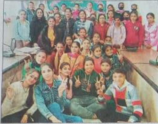
कार्यक्रम में उपस्थित उपायुक्त व अन्य तथा उपस्थित छात्राएं।