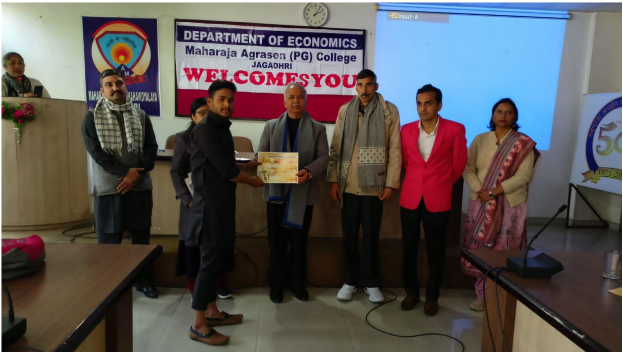
Winners of various Competitions while celebrating Azadi Ka Amrit Mahotsav