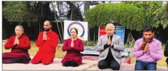
सुबह के समय सूर्य नमस्कार योग में भाग लेते कॉलेज स्टॉफ।